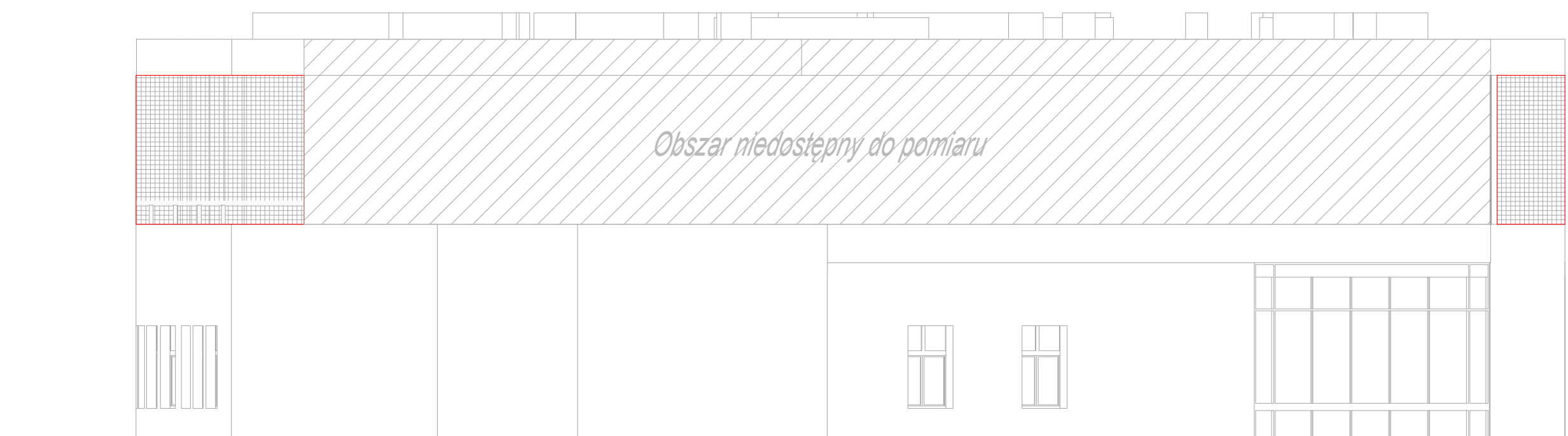
Elevacja północna, skala 1:100